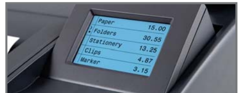
RITINĀMS LCD DISPLEJS