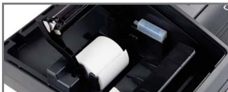
VIENKĀRŠA LENTES MAIŅA