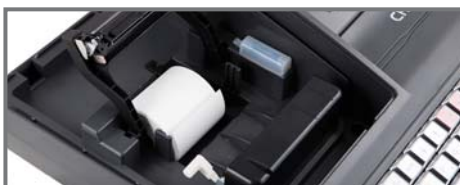
VIENKĀRŠĀ LENTES MAIŅA