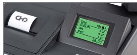
RITINĀMS LCD DISPLEJS